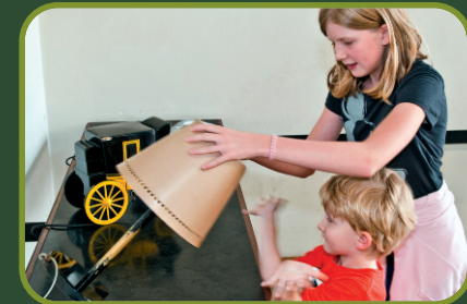
Eine Lampe umwerfen